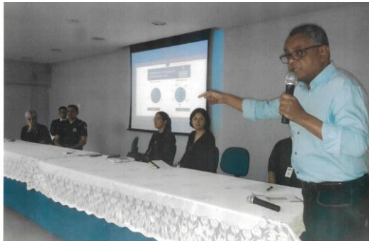
(20181025_São Miguel Paulista)