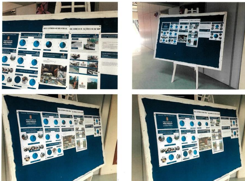
(exemplo de mural com Relatório de Obras e Ações - Sub São Miguel)